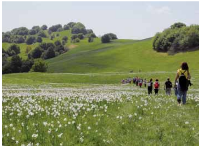
Le fioriture di Pian della Cavalla