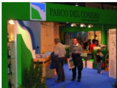
Il Parco a "Eco&Equo".

lontane geograficamente, ma accomunate dallo stesso comune denominatore: la ricerca di forme di sviluppo sostenibile per il proprio territorio e per le persone che ne traggono il sostentamento. A confermare dello spessore internazionale dell'evento, testimonial d'eccezione di Eco&Equo è stata la scienziata indiana Vandana Shiva, presente come rappresentante della Reserach Foundation for Science, Technology and Ecology (RFSTE) e l'associazione Navdanya.