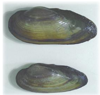
Immagine: Due esemplari adulti della specie Unio mancus .

Tale classificazione è stata proposta in seguito a diverse revisioni sistematiche nella recente Checklist delle Specie della Fauna Italiana (Minelli et al., 1995) e da Nagel (1999). Nell'ambito del genere Unio è stata osservata variabilità morfologica delle valve sia nel profilo, sia nell'altezza e nell'aspetto dell'umbone (collaborazione con il Museo di Scienze Naturali di Torino). Tuttavia allo stato attuale non vi è evidenza della presenza di specie alloctone.