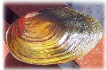
Immagine: esemplare adulto della specie Anodonta anatina .