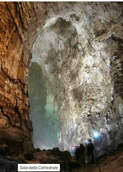
Sala della Cattedrale

30 chilometri di gallerie ed una profondità massima di quasi 1000 m, è uno dei sistemi ipogei più importanti d' Europa e sicuramente tra i più noti e studiati al mondo. Lo spettacolo naturale che fino a pochi anni fa, poteva essere apprezzato solo da esperti speleologi, si concede oggi, per circa 800 metri di percorso sotterraneo, a tutti coloro che vogliono vivere un'esperienza sensoriale unica, prodotta dal suono dell'acqua che lentamente scava la roccia, dall'odore della profondità della montagna, dalle forme stravaganti create dal calcare al suo interno. La grotta si sviluppa nel calcare massiccio, formazione costituita in prevalenza da carbonato di calcio molto puro, praticamente presente dalla sommità del monte fino al livello di base rappresentato dalla sorgente di Villa Scirca (le cui acque alimentano la città di Perugia).