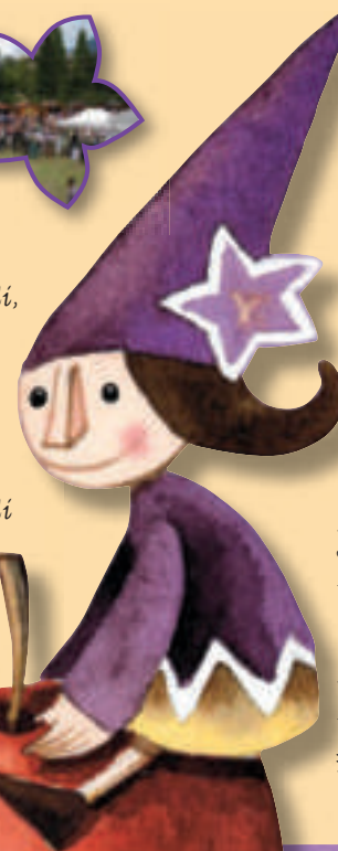
illustrazione: marta farina

Organizzazione tecnica Cooperativa "Un Mondo di Idee"