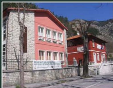
PUNTO IAT e MUSEO DEL TERRITORIO "Mannozi-Torini"

Il Museo del Territorio Mannozi-Torini si snoda in diverse sale nelle quali al visitatore è offerta un'immagine completa dei Monti del Furlo. Sono illustrati gli aspetti geografici, geologici e paleontologici della Riserva ma anche quelli relativi alla storia, all'architettura e alla cultura dell'area protetta.