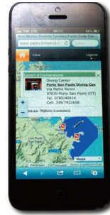
mappe (su PC e cellulare)

protette italiane, prenotate online le vostre immersioni presso i diving center segnalati, contrassegnati nelle pagine di elenco con l'icona dell'Italia Diving Tour (i centri d'immersione che esauriranno i bollini non mostreranno più l'icona a fianco).