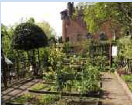
Torino, Borgo Medievale, veduta dell'orto nel giardino medievale

Nel percorso proposto si delinea lo sviluppo della medicina medievale tra scienza, superstizione e fede suggerendo un confronto con i nostri giorni. Attraverso la visita sarà possibile conoscere le varie piante officinali (medicinali, cosmetiche e aromatiche), le loro caratteristiche e il loro utilizzo nella cura della salute, evidenziandone le virtù.