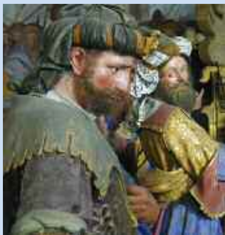
Varallo, Cappella XXXV