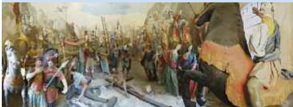
Domodossola, XI Stazione