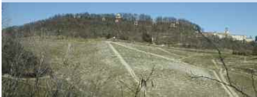
Crea, panoramica Sacro Monte