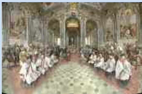
Orta, Cappella XX

I sette Sacri Monti piemontesi e due lombardi (Varese e Ossuccio) sono stati iscritti, nel 2003 con il sito "Sacri Monti del Piemonte e della Lombardia", nella Lista del Patrimonio Mondiale dell'UNESCO, con la seguente motivazione: "I nove Sacri Monti dell'Italia settentrionale sono gruppi di cappelle e altri manufatti architettonici eretti fra il XV e il XVII secolo, dedicati a differenti aspetti della fede cattolica. In aggiunta al loro significato simbolico e spirituale, possiedono notevoli doti di bellezza, virtù e gradevolezza, e risultano integrati in un ambiente naturale e paesaggistico di colline, boschi e laghi. Contengono inoltre reperti artistici molto importanti (affreschi e statue)" .