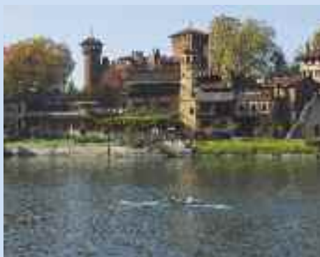
Torino, veduta del Borgo Medievale dal fiume Po

14 APRILE 🕒 15.00-16.00 e 16.00-17.00 (2 percorsi)