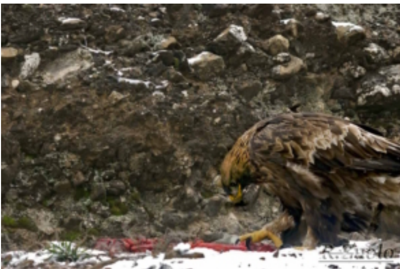
Prima foto: sfuocata e ritoccata al pc

Mentre li scorrevo sullo schermo del Pc, la mascella mi era scesa e, per l'emozione, continuavo a deglutire senza accorgermene. Non ci potevo credere!