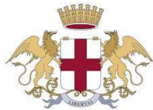
Città Metropolitana di Genova