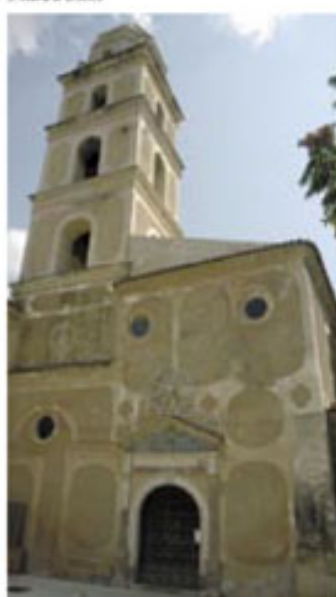
S. Maria di Orsoleo

Anno IV n. 4 Registrazione Tribunale di Matera n. 208 del 11 aprile 2003 In distribuzione gratuita Periodico di informazione del Centro di Educazione Ambientale dell'Ente di Gestione del Parco Archeologico Storico Naturale delle Chiese Rupestri del Materano Via Sette Dolori, 10 Matera 75100 Tel. 0835.336166 fax 0835.337771 info@parcomurgia.it www.parcomurgia.it