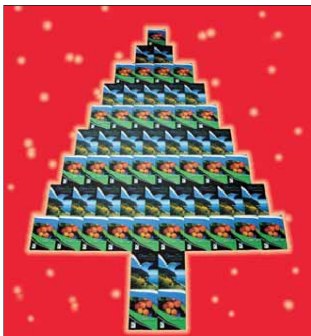
In copertina: il libro dell'Ente Parco, "Obiettivo Conero", in una simpatica composizione natalizia.