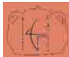
Ristorante l'Arciere Scarmagno (To)