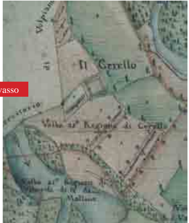
Mapa Francese, 12 Brumaio anno II