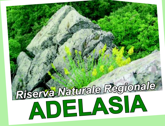
Riserva Naturale Regionale ADELASIA